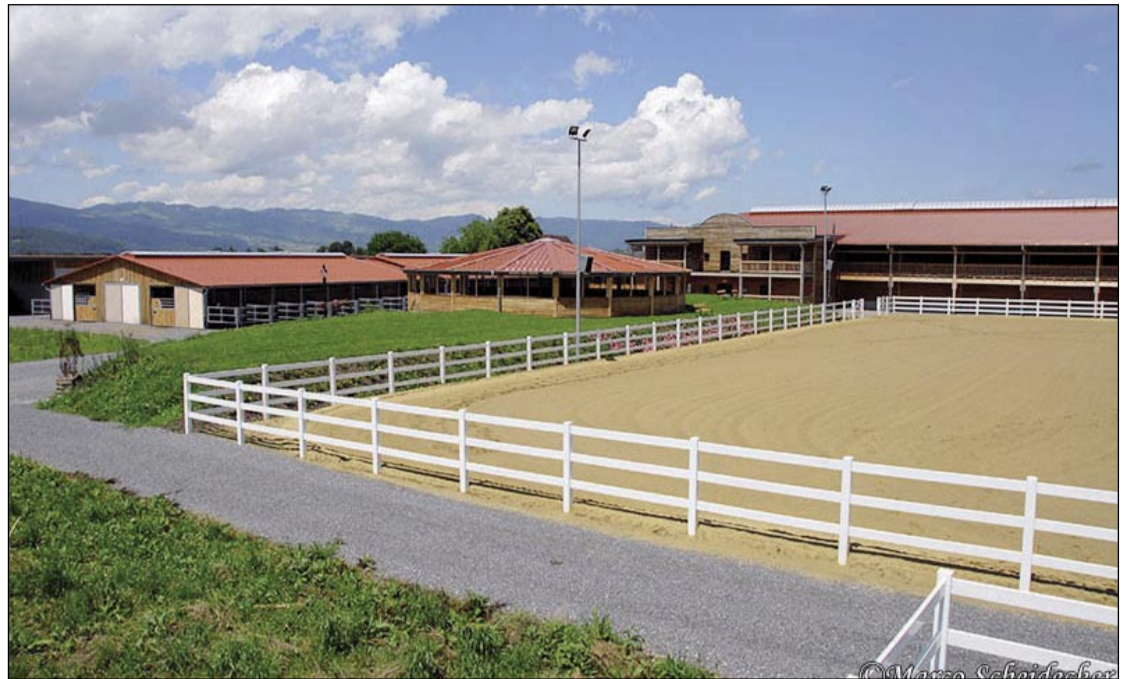
Die großzügige Reitanlage ist auf dem neuesten Stand der Technik.